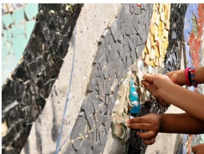
ATELIER MOSAÏQUE

Réaliser une œuvre de mosaïque participative avec de la céramique artisanale et recyclée afin de permettre aux Onésien-ne-s d'embellir et de s'approprier un bout de quartier, tout en stimulant leur fierté, leur confiance et leur intérêt à entreprendre des projets collectifs.