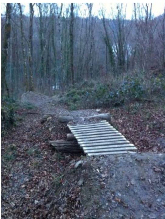
SUR LE TRACÉ ACTUEL

Le vélo de descente "Downhill" se pratique sur un terrain ayant un bon dénivelé. Le tracé actuel existe depuis longtemps dans le Bois-de-la-Chapelle, mais n'est pas officiel, il doit être reconstruit régulièrement et présente des conditions de sécurité précaires. Le but est de faire une piste accessible formellement reconnue et conforme aux normes de sécurité.