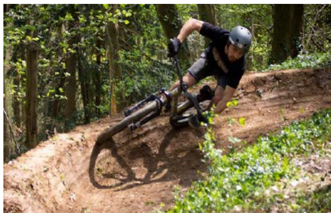
VIRAGE RELEVÉ SUR UNE PISTE AMÉNAGÉE

Les porteurs de projets ont été entendus en séance du COPIL le 27 avril 2016. Le projet est complexe et de nombreux points clés doivent être analysés et clarifiés, notamment au niveau technique, organisationnel, administratif, légal et environnemental, en lien avec différents services étatiques.