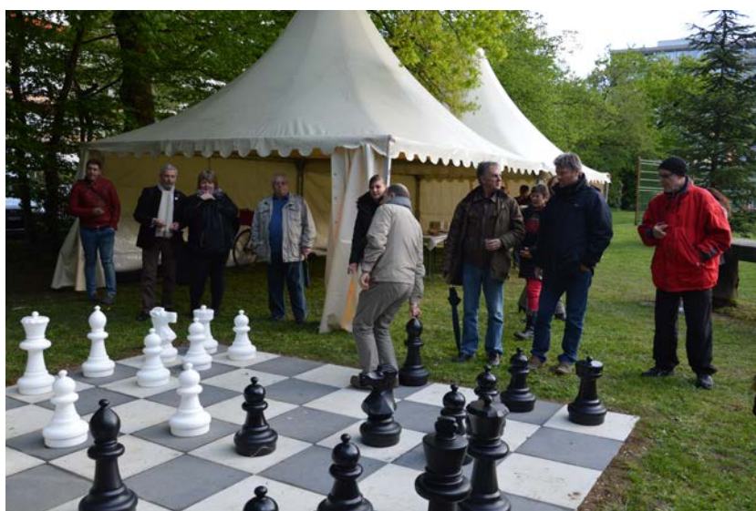
LORS DE L'INAUGURATION

En séance du 23 septembre 2015, le COPIL a validé le soutien financier et les travaux ont débuté le 14 décembre 2015. L'inauguration a eu lieu le 26 avril 2016, en présence de membres du GSP, du COPIL, des représentant-e-s des autorités communales et des habitant-e-s.