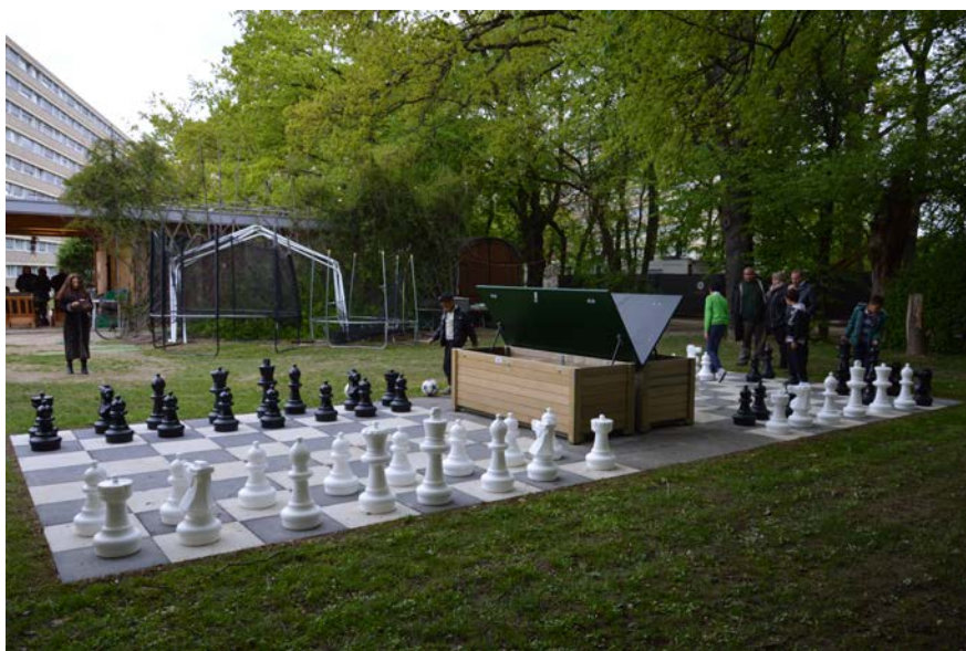
RÉALISATION DU PROJET

Offrir la possibilité aux habitant-e-s de la Ville d'Onex de pratiquer les échecs sur un emplacement gratuit et accessible à tous.