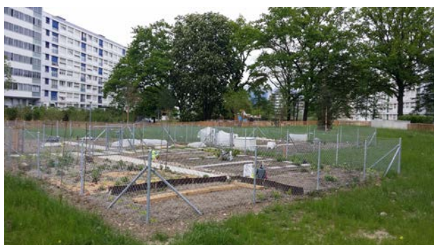
RÉALISATION DU PROJET

Création d'un lieu de rencontres autour de jardins potagers dans la partie supérieure du parc attenante à la rue du Gros-Chêne. Le but de ce projet est également de promouvoir le rapprochement des habitant-e-s à la nature dans un milieu urbain comme Onex-Cité.